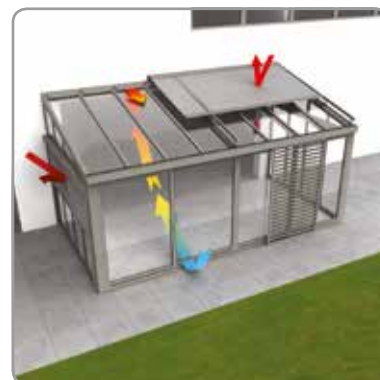
Healthy veranda concept®