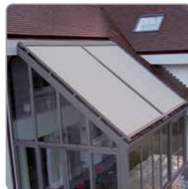
Gekoppelde montage op veranda